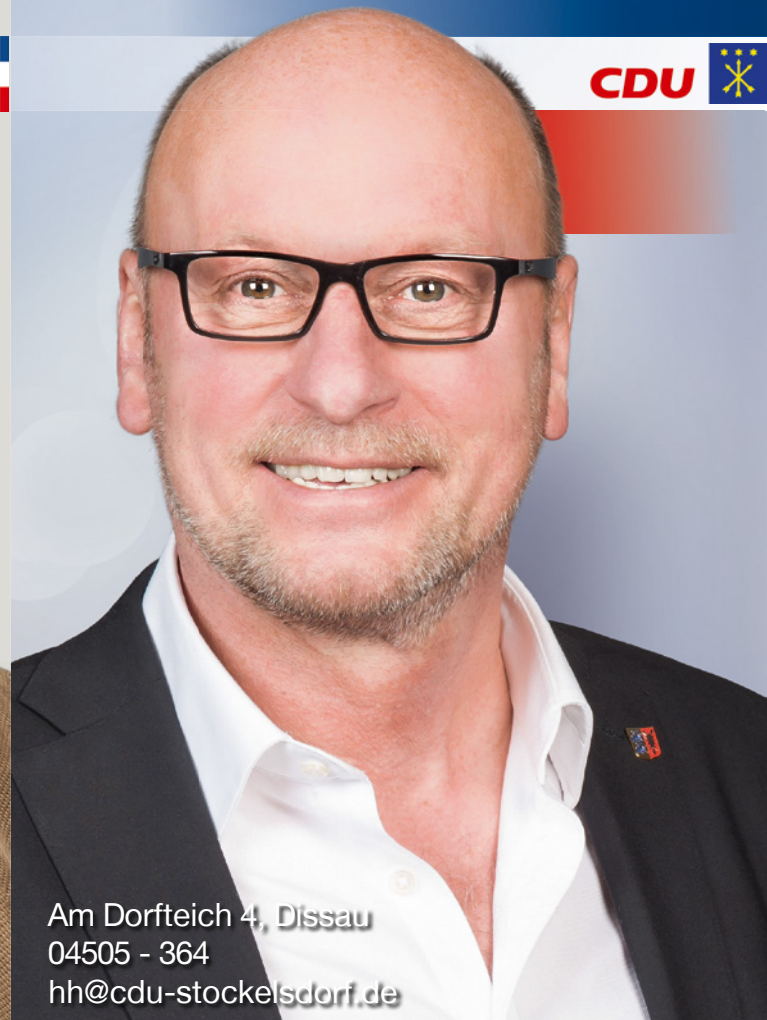
Am Dorfteich 4, Dissau 04505 - 364 hh@cdu-stockelsdorf.de