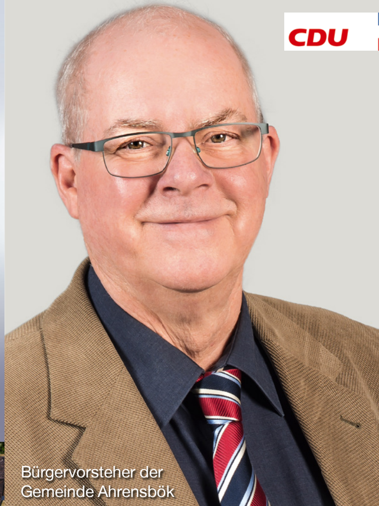
Bürgermeister der Gemeinde Ahrensböök

Glasfaserausbau in sieben Dorfschaften durch die Stadtwerke Lübeck.