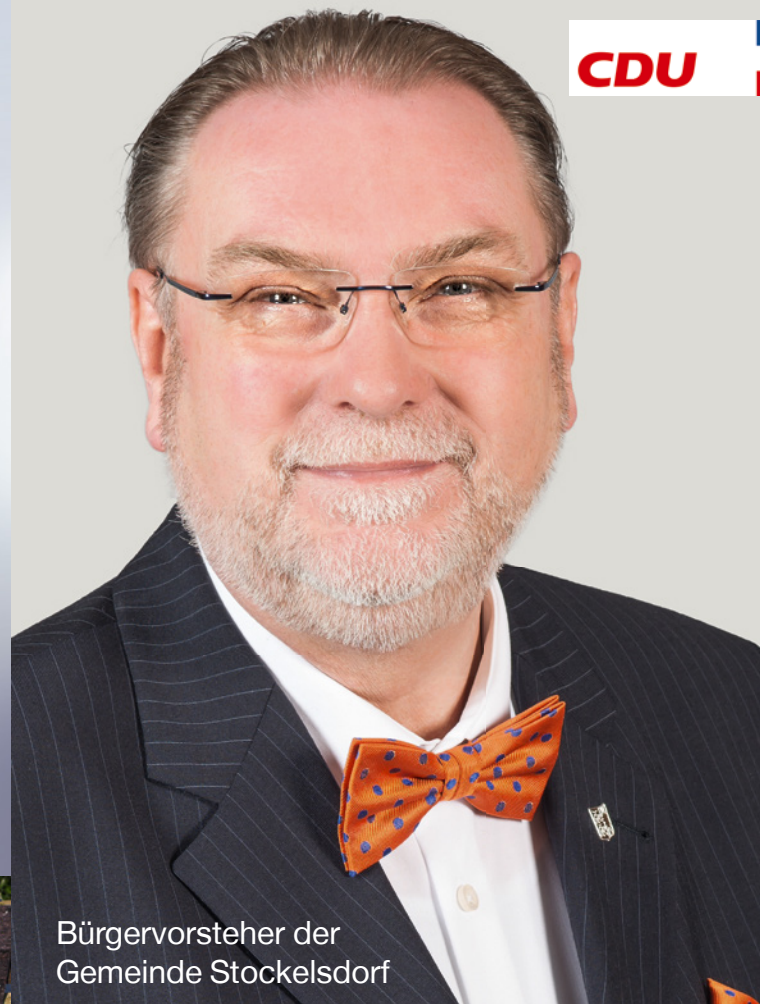
Bürgermeister der Gemeinde Stockelsdorf