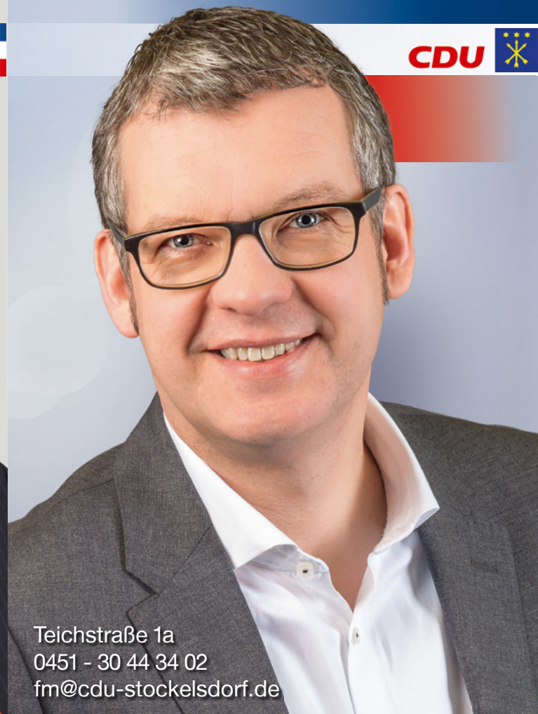
Teichstraße 1a 0451 - 30 44 34 02 fm@cdu-stockelsdorf.de